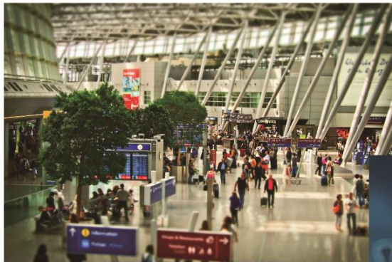
空港、商業施設出入口