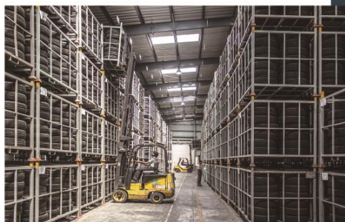
工場、倉庫などの出入口