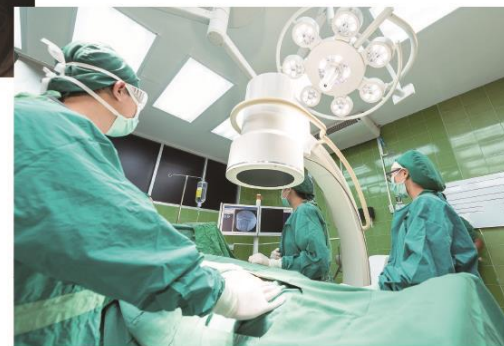
病院、クリニックなど