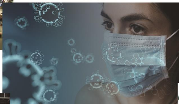
新型コロナウイルスの予防